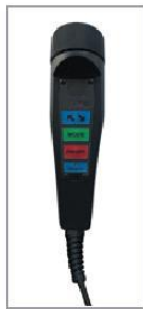
Comandi azionamento piastre su torcia con cavo di 5500mm. Standard play detector controls on torch with 5500mm cable.