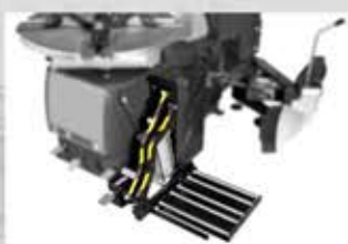
Lift ridicare roti