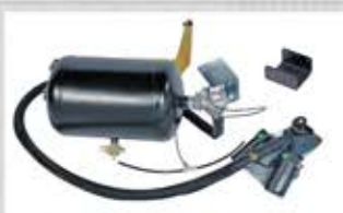
Tun de aer