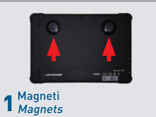
1 Magneti Magnets