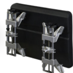
La foto include pannelli opzionali STDA156 The picture includes optional panels STDA156