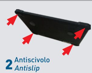
2 Antiscivolo Antislip